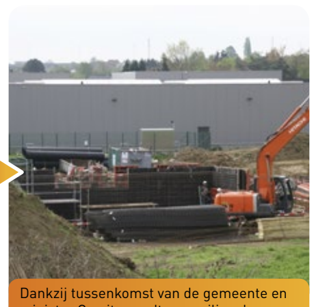
Dankzij tussenkomst van de gemeente en minister Crevits wordt een veilige doorsteek mogelijk gemaakt voor een optimale bereikbaarheid van de bedrijven.