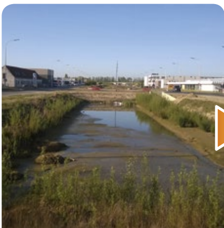
Vlaanderen, de provincie en de gemeente pakt samen de wateroverlast aan.

Zonder samen te werken met buurgemeenten, met onze mensen in de provincie of met de parlementairen en ministers lukt het niet om u de leefomgeving te bieden die u verdient. Dat doen we, al jarenlang. De resultaten, daar geniet u reeds elke dag van. Daarom is uw stem op uw lokale kandidaat zo belangrijk: voor uw fietspad, rondpunt of bib... Kies op 25 mei voor uw lokale kandidaten en kies voor een partij die al zoveel keer bewezen heeft, dat ze kan samenwerken. Een zekerheid waar je een sterke toekomst kunt op bouwen. Ook in uw gemeente.