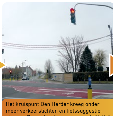
Het kruispunt Den Herder kreeg onder meer verkeerslichten en fietssuggestiestroken. De werken kwamen er op initiatief van minister van Mobiliteit en Openbare Werken Hilde Crevits.